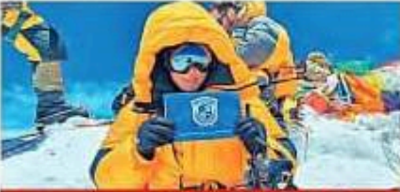
અરુણાચલમાં પાંચમી અને નિધિ સમુદાયમાં પ્રથમ યુવતી તરીકે માન મેળવ્યું

ગત ૨૧ મી મેએ માઉન્ટ એવરેસ્ટની ટોચ ઉપર પહોંચીને એવરેસ્ટ સર કરવાની સિધ્ધી નોંધાવી હતી. મહિલા અરુણાચલ પ્રદેશની પાંચમી અને તેના નિધિ સમુદાયની પ્રથમ