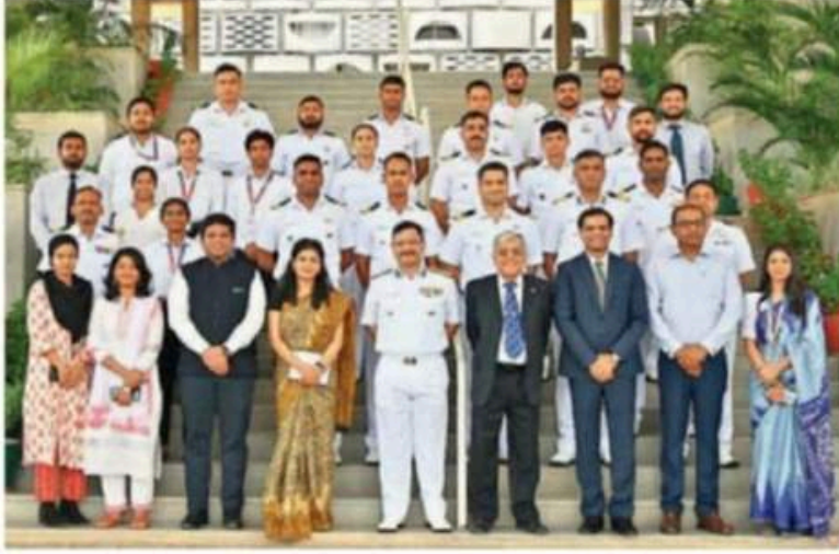
RRU and ICG officers on the inauguration of first training session.