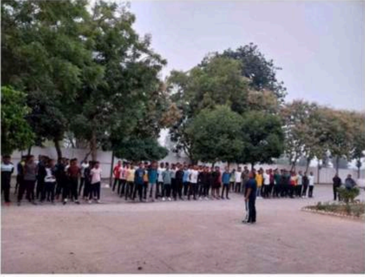
RRU Emerging Global Address for National Security Gujarat's tribal youth excels in Agniveer exam

RRU : રાષ્ટ્રીય રક્ષા યુનિવર્સિટી (આરઆરયુ) એ આદિવાસી કલ્યાણ વિભાગ (ગુજરાત સરકાર) ના સહયોગથી 2023 ના મધ્યમાં એક પહેલ શરૂ કરી હતી.