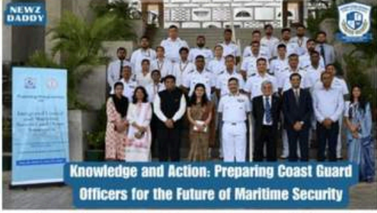
Knowledge and Action Preparing Coast Guard Officers for the Future of Maritime Security

Rashtriya Raksha University and Indian Coast Guard Launch Groundbreaking Maritime Security Training Program